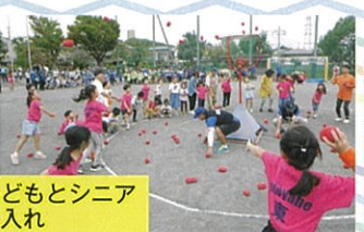
子どもとシニア 玉入れ