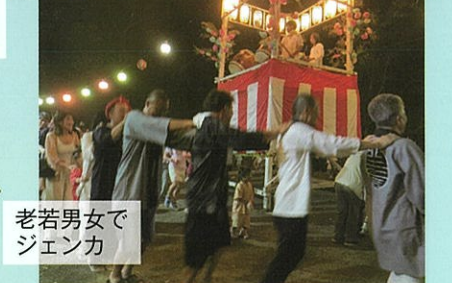
老若男女で ジェンカ