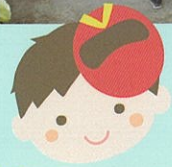
鳥が丘自治会 鳥が丘ドルチェ自治会 8月24日