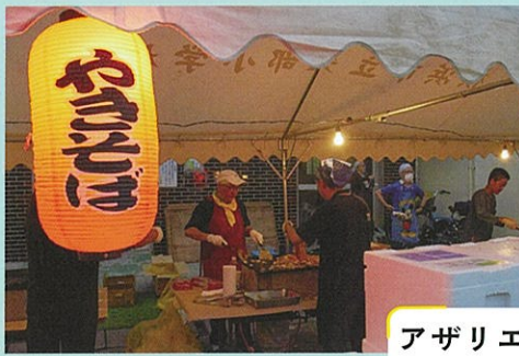
アザリエ自治会 7月27日