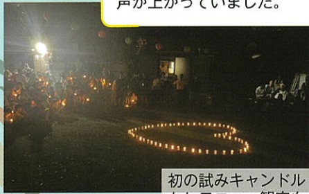
初の試みキャンドル セレモニー。観客も ライトを手に見守り ました