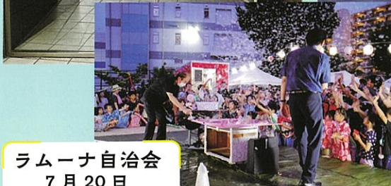
ラムーナ自治会 7月20日