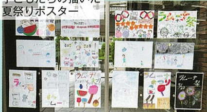
子どもたちの描いた 夏祭りポスター