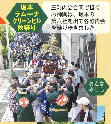
坂本ラムーナグリーンヒル秋祭り