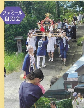
ファミリー自治会