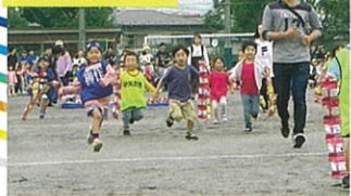
ちびっ子たちのおやつ競走