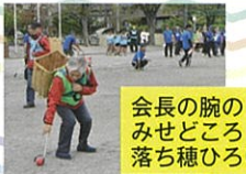
会長の腕のみせどころ 落ち穂ひろい