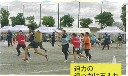
迫力の追っかけ玉入れ