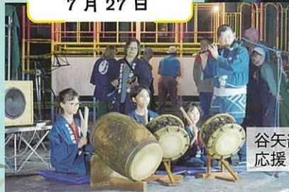
谷矢部囃子連中も 応援してくれました