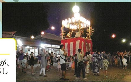
毎年恒例の ナイアガラ

夜になっても蒸し暑い日でしたが、 浴衣姿の子ども達も参加して楽し い盆踊りとなりました。 大きくきれいな花火には大きな歓 声が上がっていました。