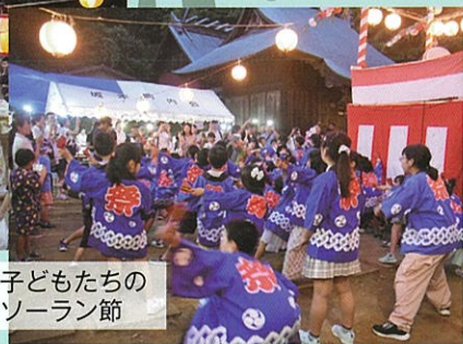
子どもたちの ソーラン節