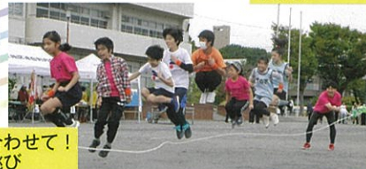
息を合わせて! 大縄跳び