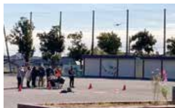
◀カメラを搭載したドローンで高所から広域を確認

鳥が丘小学校地域防災拠点訓練では、ハマッコトイレの組み立ての他、無線で各地域との連絡訓練、大容量のガス釜「まかない君」による炊きだし訓練、ラムーナ自治会協力のもとドローンでの被害状況確認訓練が行われました。無線訓練では鳥が丘自治会をはじめ、坂本町内会、ラムーナ自治会などの拠点とも無線で連絡を取り合い、被害情報、避難者情報などの情報収集を行いました。