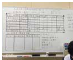
▶各地域の情報をホワイトボードに書き出す