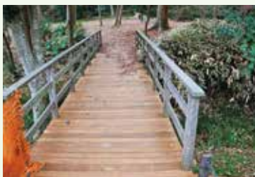
樹林部奥の橋（修繕後）