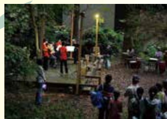
戸塚中学校吹奏楽部アンサンブル