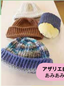
アザリエ自治会 あみあみ教室