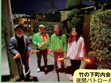
竹の下町内会 夜間パトロール