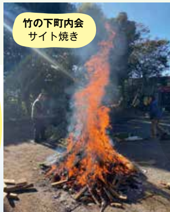
竹の下町内会 サイト焼き