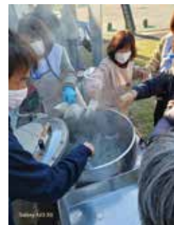
▲最大100Lの容量で調理が可能なまかない君