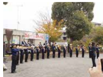
鳥が丘小学校マーチングバンド