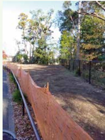
さちが丘線側樹林部（伐採後）

工事中、公園にいらっしゃった方々には、ご不便をおかけしましたが、地域の皆様のご協力で、トラブルもなく進みました。ありがとうございました。これからも、整備された公園を愛護会として守っていきますので、地域の皆様も足をお運びください。