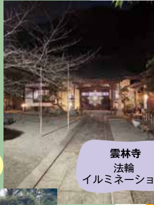
雲林寺 法輪 イルミネーション