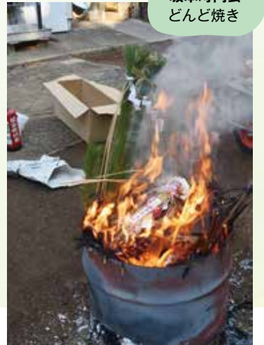
坂本町内会 どんど焼き