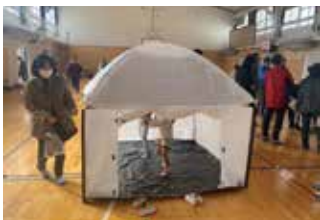
◀室内テント組み立て