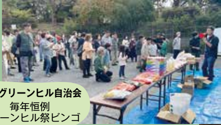
戸塚グリーンヒル自治会 毎年恒例 グリーンヒル祭ピンゴ