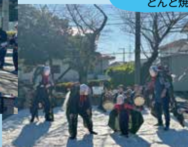
鳥が丘自治会 鳥が丘ドルチェ自治会 どんど焼き

晴天に恵まれ、多くの方々が賑わいました。 お囃子の演奏に合わせて獅子舞も舞踊りました。