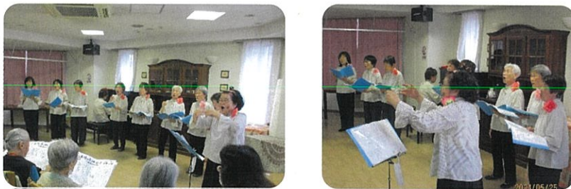
～花珠の家ひがしとつかでの活動の様子～

施設の方がかけてくださるお声を励みにされ、「みなさまが楽しそうに一緒に歌っていただけることが嬉しい」「私達も胸がいっぱいになる」「歌っていいなあ、と思ってもらえるように私達も頑張りたい」とのお話は、多くの活動者の皆さまも、共感されるのではないのでしょうか。